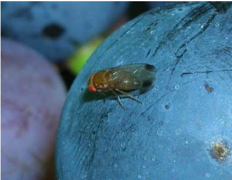
Männchen mit dunklen Flügelflecken